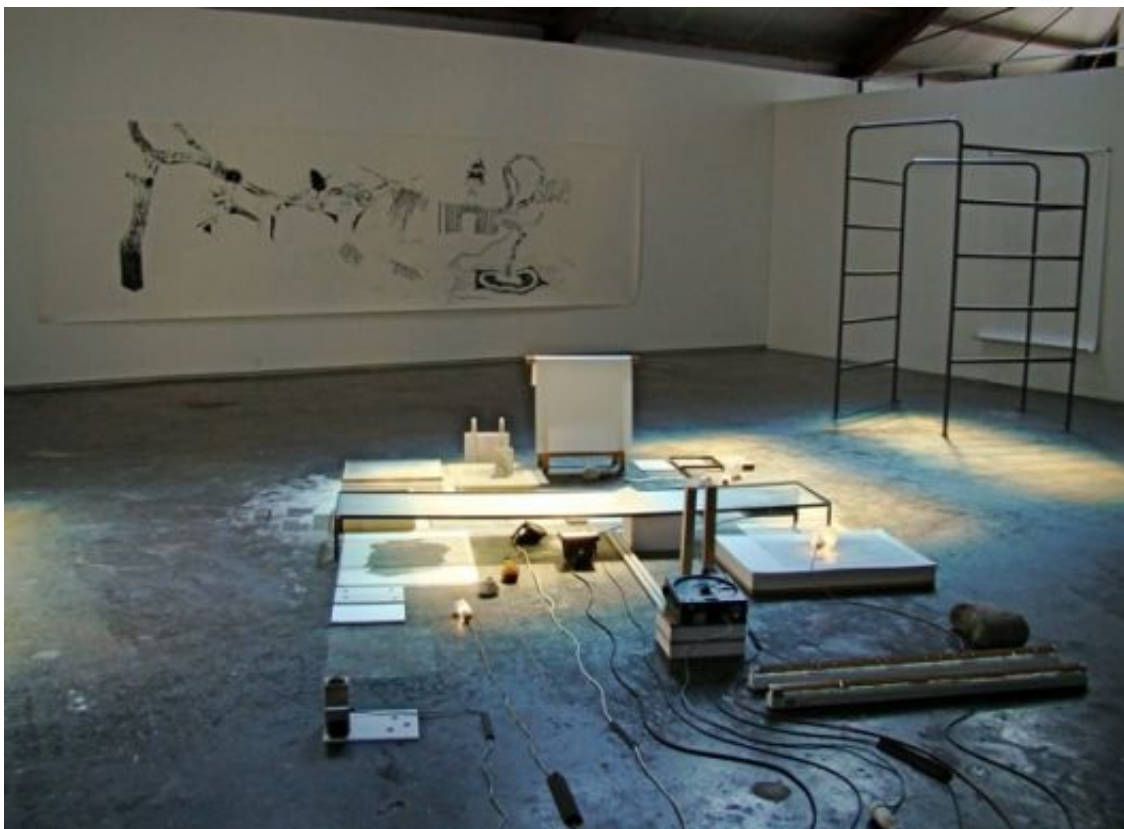
Overzicht Nieuw Dakota