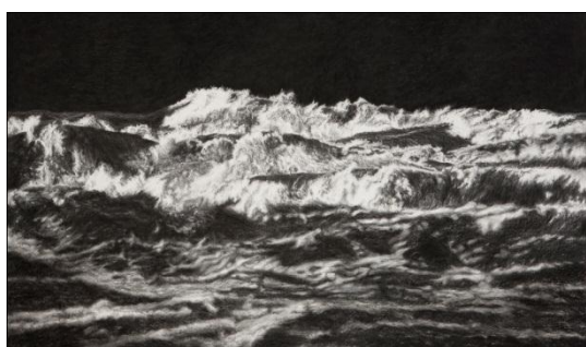
Black Sea II (2011), 152x263cm, houtskool pastel op museumkarton