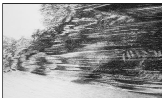
Moving Landscape (2011), 153x263cm, houtskool pastel op museumkarton