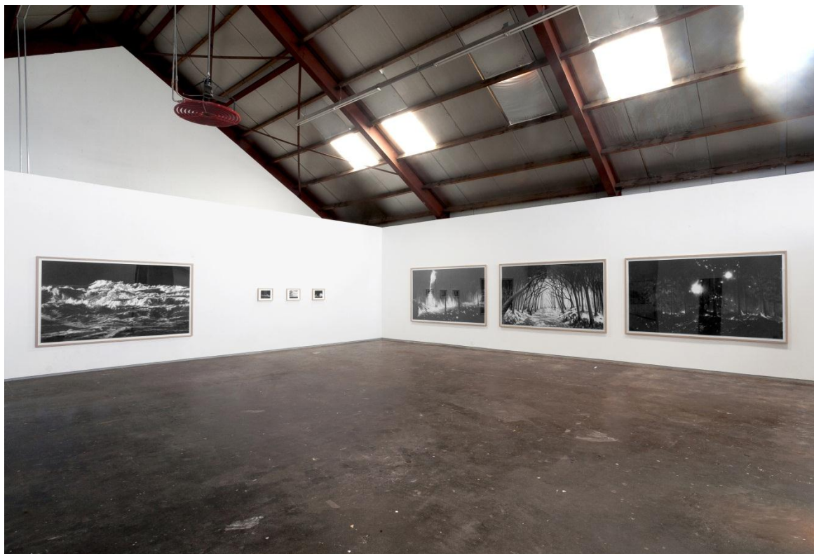
Zaaloverzicht, 2011