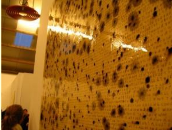
Gelaagd, met de glans van epoxy

Masterpiece', wat niet anders dan ironisch bedoeld kan zijn. Volgens de beschrijving gaan de teksten over het fictieve bedrijf QP&S en stellen ze onder andere kritische vragen bij de plaats van kunst en economie in de maatschappij.